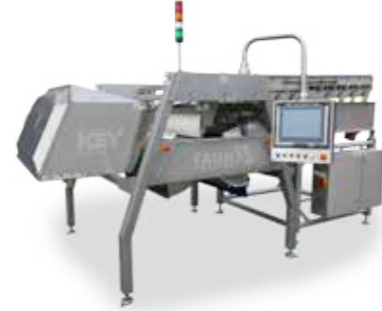
Taurys™ Gelişmiş Lazerli Ayıklayıcı