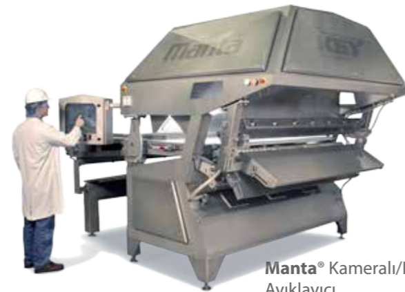
Manta® Kameralı/Lazerli Ayıklayıcı