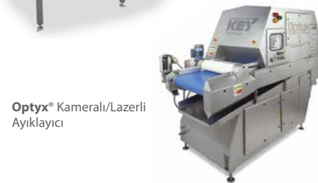
Optyx® Kameralı/Lazerli Ayıklayıcı