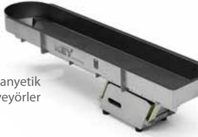
Impulse® Elektromanyetik Konveyörler