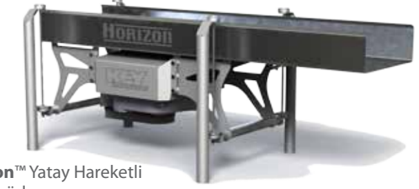
Horizon™ Yatay Hareketli Konveyörler

Patatesler • Sebzeler • Meyveler • Çerezler • Atıştırmalıklar • Tahıllar • Hamur Kaplamalı ve tatlandırılmış ürünler • Et Ürünleri • Eczacılık Ürünleri için... ve işte sizin uygulamanız.