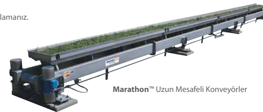
Marathon™ Uzun Mesafeli Konveyörler

• Sıhhi tasarım, az bakım ve kolay kullanım