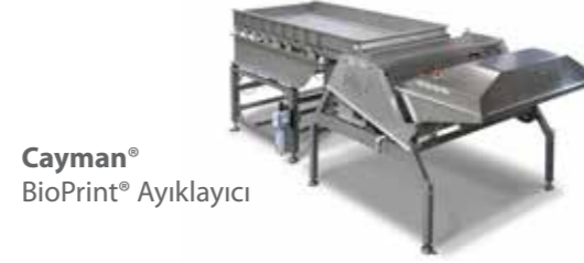
Cayman® BioPrint® Ayıklayıcı

Key'in yenilikçi yazılım çözümleri, FM olaylarını, kalite verilerini ve eğilimlerini izlemenize, ayıklayıcınızı web tabanlı tanı yoluyla proaktif olarak takip etmenize ve gelişmiş kontrollere gerçek zamanlı, tam hat akış verileri üzerinden erişmenize olanak verir.